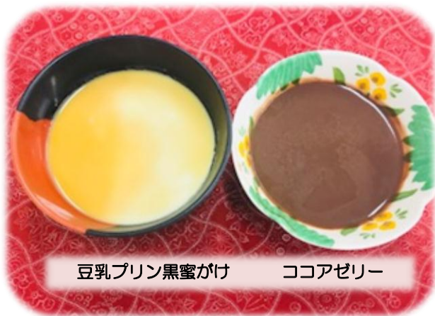
豆乳プリン黒蜜かけ