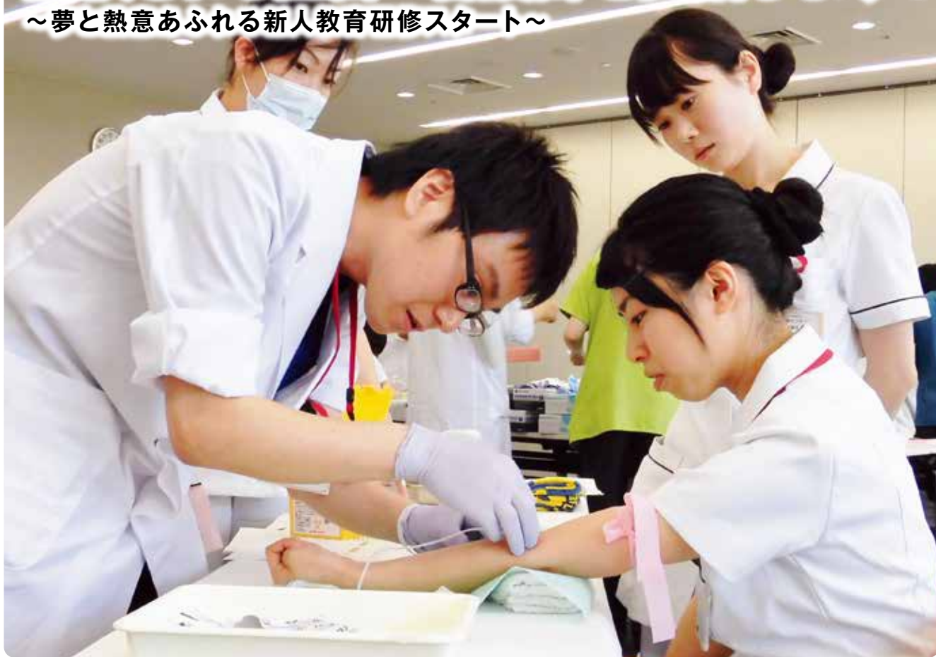
採血練習をしている研修医(左)と看護師