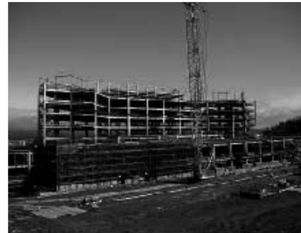
病院建物の南側から撮影しています。(平成24年2月末現在)