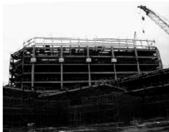
病院建物の西側から撮影しています。(平成24年2月末現在)