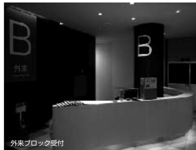
外来ブロック受付

4月6日から掛川・袋井の両病院において、モデルルームを一般公開します。事前の申込みは不要です。皆様のご来場をお待ちしています。