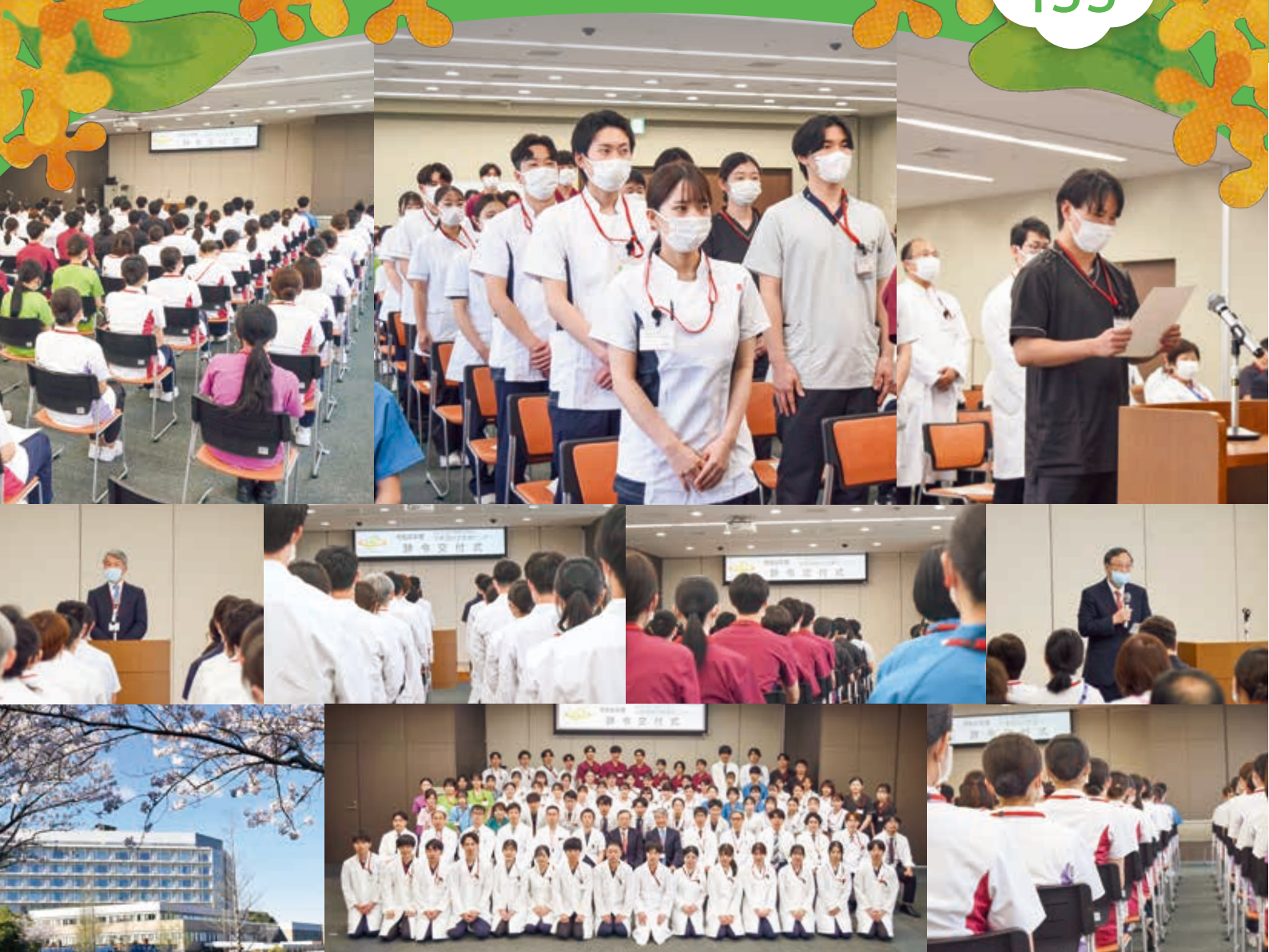
4月1日に行われた辞令交付式