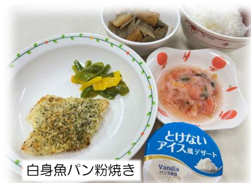
白身魚パン粉焼き

3月2日から新メニューがスタートしました。これまで以上に、厨房スタッフ全員が一丸となって病院給食の提供を行っています。初めてのメニューに戸惑うこともありますが、試行錯誤を重ねながら、より美味しく、安心して召し上がっていただける給食を目指しています。ぜひ、感想を聞かせてください！