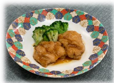
3位 照り焼きチキン