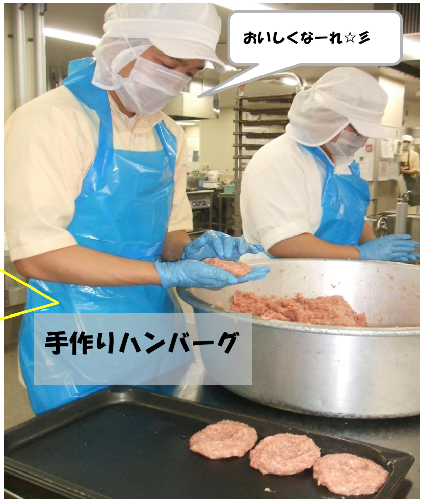
手作りハンバーグ

ハンバーグはお肉をしっかりこねて、ひとつひとつ形を整えます。うま味と愛情を閉じ込めてオーブンで焼いていますよ。患者さんからも「肉汁が出てきておいしいね」と好評です。